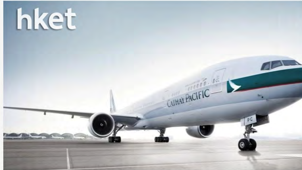
▲ 國泰航空此前宣布重組方案，計劃裁員約8500人。

國泰航空 (00293) 日前宣布，削減8500個工作職位，並停止營運國泰港龍航空，部分留任員工需於14天內簽署新合約。香港航空機組人員協會 (HKAOA) 要求勞工處介入，就國泰航空集團最近的重組方案採取行動。